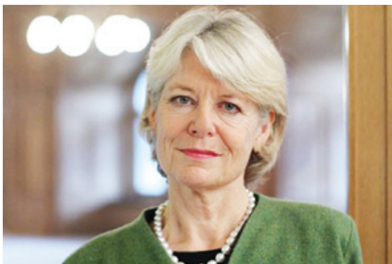
Verena Diener , Zürich Ständerätin glp

« Eine neue energiepolitische Weichenstellung ruft auch nach neuen Lenkungsinstrumenten. Mit der Einführung einer Energiebesteuerung auf nicht erneuerbarer Energie und der gleichzeitigen Abschaffung der Mehrwertsteuer fördern wir Innovation und Wertschöpfung.