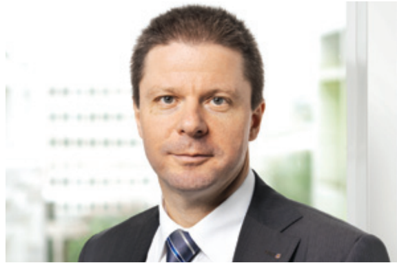
Martin Bäumle , Dübendorf Atmosphärenwissenschaftler und Parteipräsident glp CH

Als Mutter habe ich nicht nur die Verantwortung für mich, sondern will meinen Kindern eine intakte Umwelt hinterlassen. Klar, dass ich mich da engagiere! »